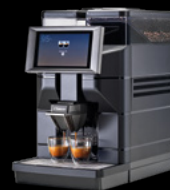
Magic B2 / B2+