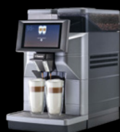
Magic M2 / M2+